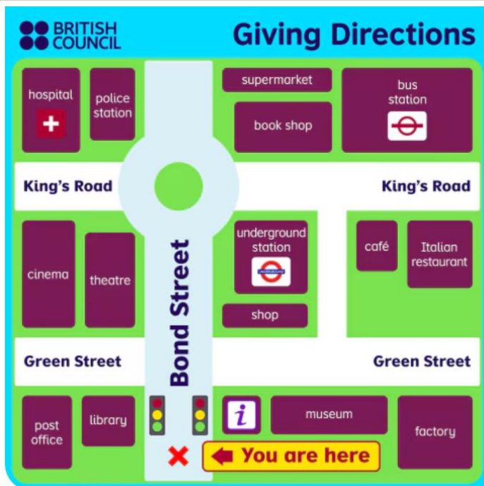
Mapa visual de apoyo para vocabulario y rutas.